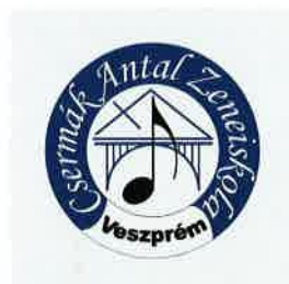
Csermák Antal Zeneiskola Veszprém Ungarn

Wir kooperieren mit allgemeinbildenden Schulen, Kindertagesstätten und Musikvereinen. Dazu gehören unter anderem: Joseph-von-Fraunhofer-Gymnasium Cham, Benedikt-Statler-Gymnasium Bad Kötzing, Realschule Waldmünchen, Grundschule Cham, Grundschule Stamsried, Stamsrieder Blasmusik, Musikverein Falkenstein und Blaskapelle St. Nikolaus Heinrichskirchen.