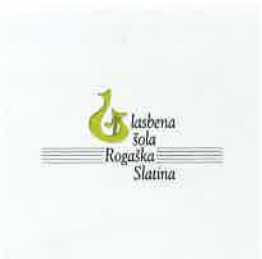
Glasbena šola Rogaska Slatina Republik Slowenien