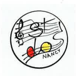
Saint Dominique Nancy Frankreich