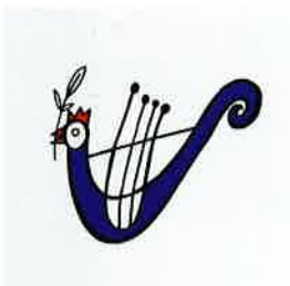
ZUŠ Jindřicha Jindřicha Domažlice Tschechische Republik